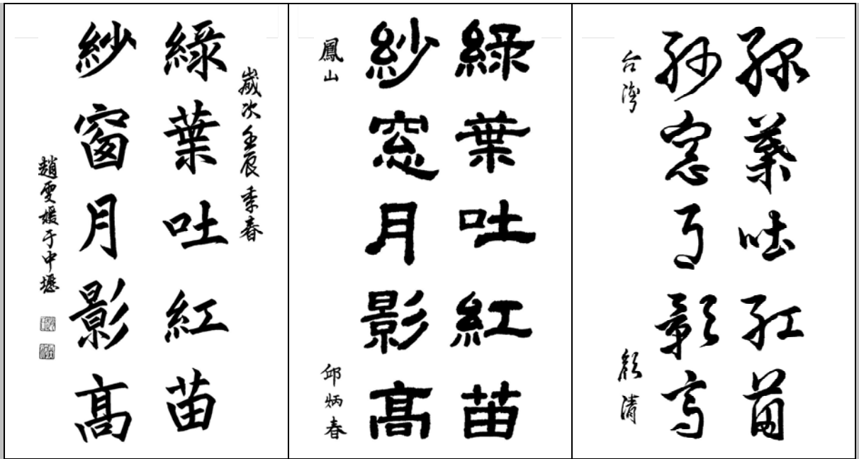
B 準二段 趙雯媛

①首次習作的成績，都儘以壓低評定，以期日後有更大的進步空間。請勿計較此制度，因好的作品很快就能上升到該有的級、段位。